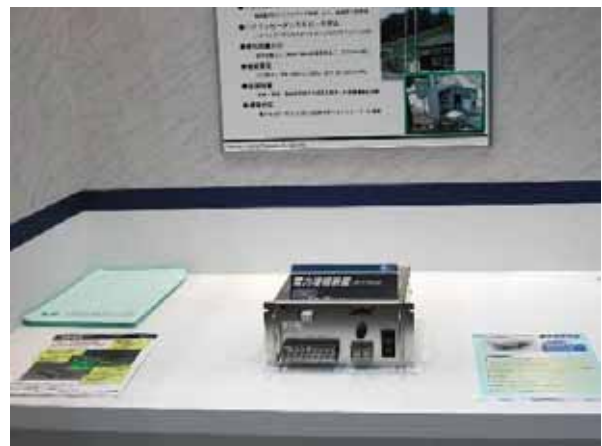
【自社製品展示スペース】 電力増幅装置の展示