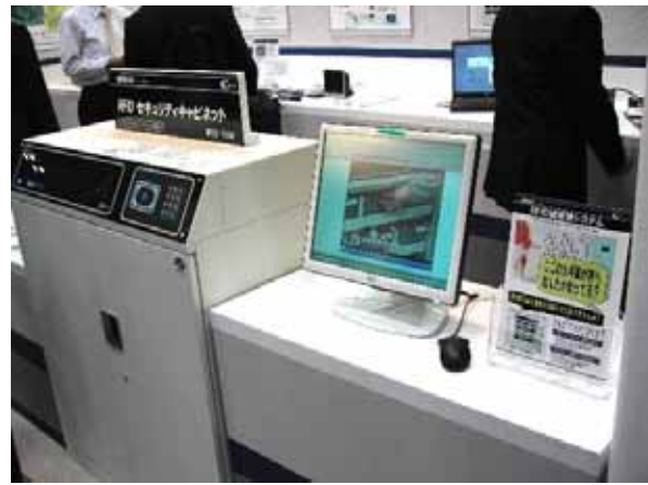
RFIDセキュリティキャビネット