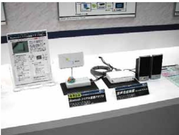
【自社製品展示スペース】 「音声合成装置」と「Bluetoothアダプタ」の デモンストレーション